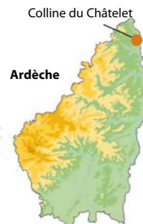
La colline du Châtelet est située sur la rive droite du Rhône, à hauteur d'Annonay, à cheval sur les communes d'Andance, Saint-Désirat et Saint-Etienne-de-Valoux.