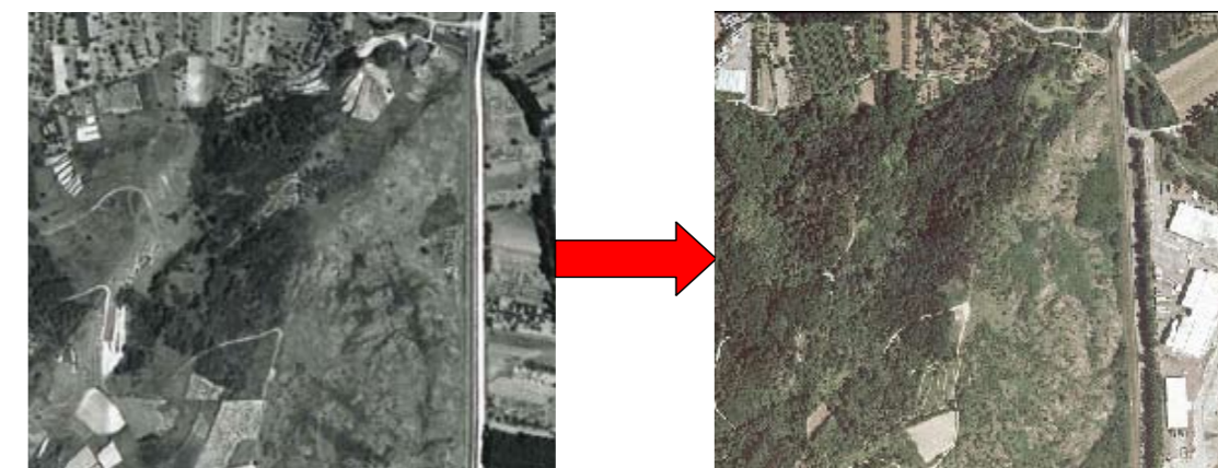
Le secteur des Coullières en 1950 (à gauche) et en 2002 (à droite). Ces photographies aériennes illustrent bien la progression de la forêt sur toutes les zones ouvertes, suite à l'abandon progressif des pratiques agricoles.

Des échanges avec la commune d'Andance sont en cours afin de transmettre la gestion de la station de gagée du Calvaire à la commune.