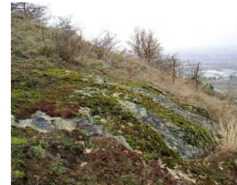
Végétation pionnière sur un affleurement rocheux.