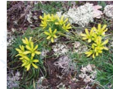
La gagée de Bohème

Cette petite fleur, de la famille des lys, garde ses secrets pour le visiteur averti : elle ne mesure que quelques centimètres, fleurit en janvier-février et pousse principalement sur des zones escarpées.