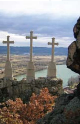
Les Trois Croix