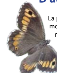
Le mercure se rencontre au sein des pelouses sèches de la colline du Châtelet.

La présence de rochers et de pelouses (végétation herbacée plus ou moins rase) en mosaïque avec des landes, des fourrés et des boisements participe à la richesse du site.