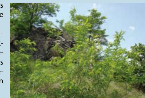
Développement du robinier

Par contre, le robinier faux-acacia se développe de manière notable sur certains secteurs, notamment lorsqu'il a été préalablement coupé. Sa présence aux abords des gagées est préjudiciable car son développement aboutirait à une forêt, avec la disparition des secteurs ouverts favorables à la gagée.