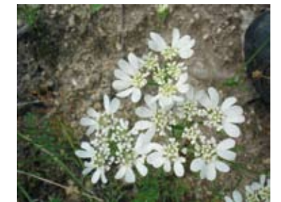
Orlaya à grandes fleurs.