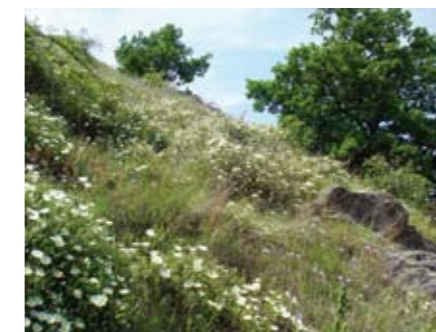
Lande à ciste.