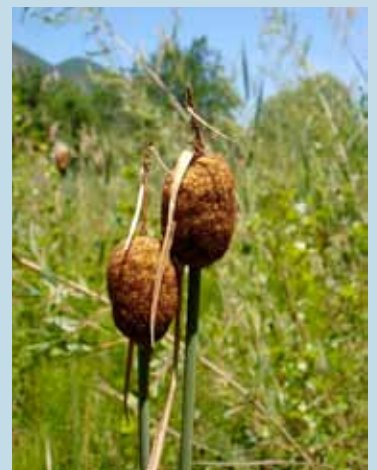
La petite massette.

Cette pelouse sèche riche en orchidées est menacée par le boisement. Les actions consisteront à réouvrir des espaces récemment colonisés par les pins, tout en facilitant le passage du troupeau du deuxième éleveur de l'AFP installé à proximité. D'autres secteurs de pelouses sèches pourraient aussi bénéficier d'opérations de gestion concertée alliant la préservation des milieux naturels et l'activité pastorale, avec également un rôle dans l'entretien des bandes pare-feu.