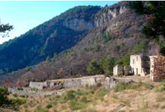
Des terrasses de cette qualité sont uniques dans le sud de la Drôme (CAUE, 2001).

La présence humaine a façonné le paysage et créé des milieux ouverts (cultures, parcours de pâturage,...). Les boisements étaient également exploités (coupe de bois, ramassage des châtaignes). À partir des années 1950, l'absence de pâturage a entraîné l'embroussaillage des milieux ouverts.