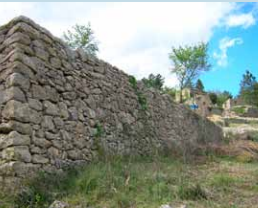
Des ruines ont été consolidées et des murs en pierres sèches restaurés.

Afin d'obtenir des milieux ouverts favorables à la recherche de proies pour les rapaces, de nombreux chantiers de débroussaillage manuel ou mécanique ont été réalisés. L'entretien par le pâturage est hétérogène et il est difficile pour l'éleveur d'accentuer la pression de pâturage, lors de son passage aux Perdignons pendant la période-clé de l'agnelage. Une opération de semis d'espèces prairiales a été réalisée en 2010 sur la partie nord des Perdignons pour mieux valoriser ce secteur.