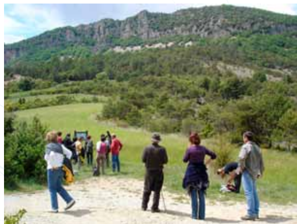
Le sentier pédagogique lors d'une réunion du comité de gestion sur le site.