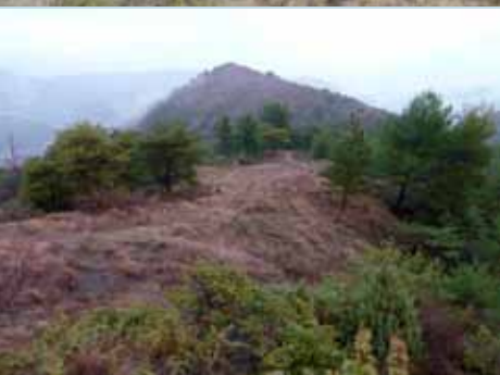
Le même secteur en 2010 avant les travaux (photo du haut) et en 2011 après les travaux.