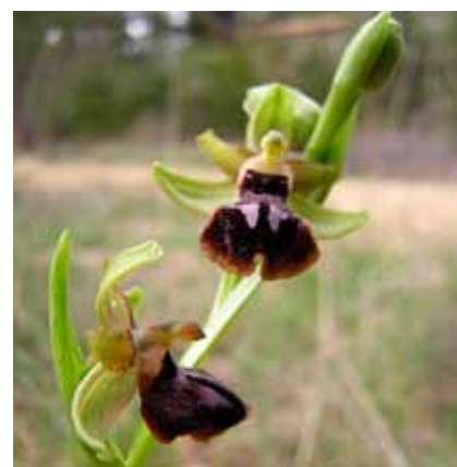
Une orchidée, l'ophrys araignée.