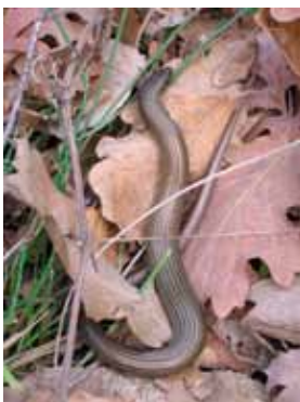
Un reptile, le seps strié.

Ces milieux très riches en termes de biodiversité ont été façonnés par l'homme, ils disparaissent sans entretien. Diverses espèces d'orchidées y sont observées, ainsi que de nombreux reptiles, parmi lesquels, la couleuvre de Montpellier, le lézard ocellé et le seps strié.