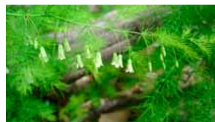
L'asperge à feuilles étroites.