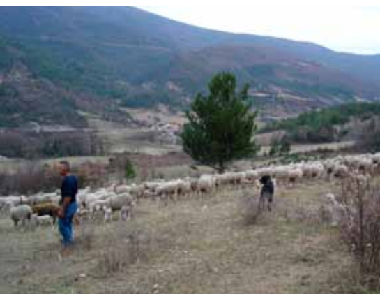
L'éleveur et son troupeau.

Même si un sentier pédagogique a été mis en place en 2005, avec des panneaux présentant les intérêts du site, la fréquentation reste très modeste. L'activité de chasse se résume à quelques battues aux sangliers.