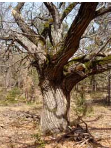
Un vieux châtaignier.

De vieux châtaigniers, aux formes impressionnantes, sont présents aux abords des ruines. L'existence d'une flore silicicole (qui pousse en terrain acide) telle que le châtaignier, la fougère aigle ou encore l'asperge à feuilles étroites dans un site majoritairement calcaire s'explique par la présence de grès.