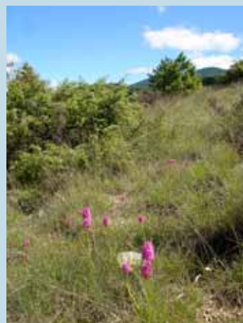
La pelouse des Gleizes.