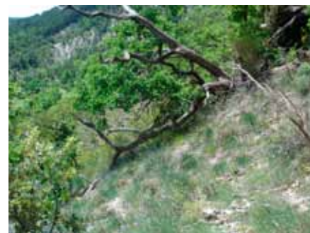
Pelouse à aphyllanthe.