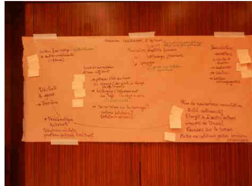
Concertation autour du nouveau programme d'actions du marais de Boistray