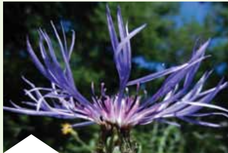
Centaurée de Lyon