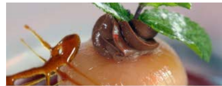
La recette du jour