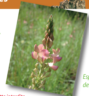
Esparcette des sables