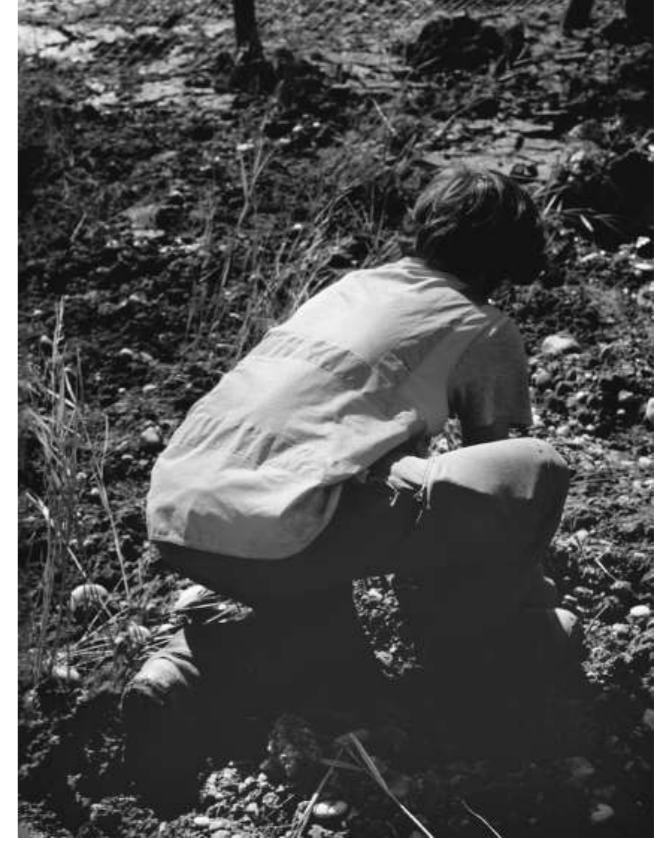
Sans titre, 2022.