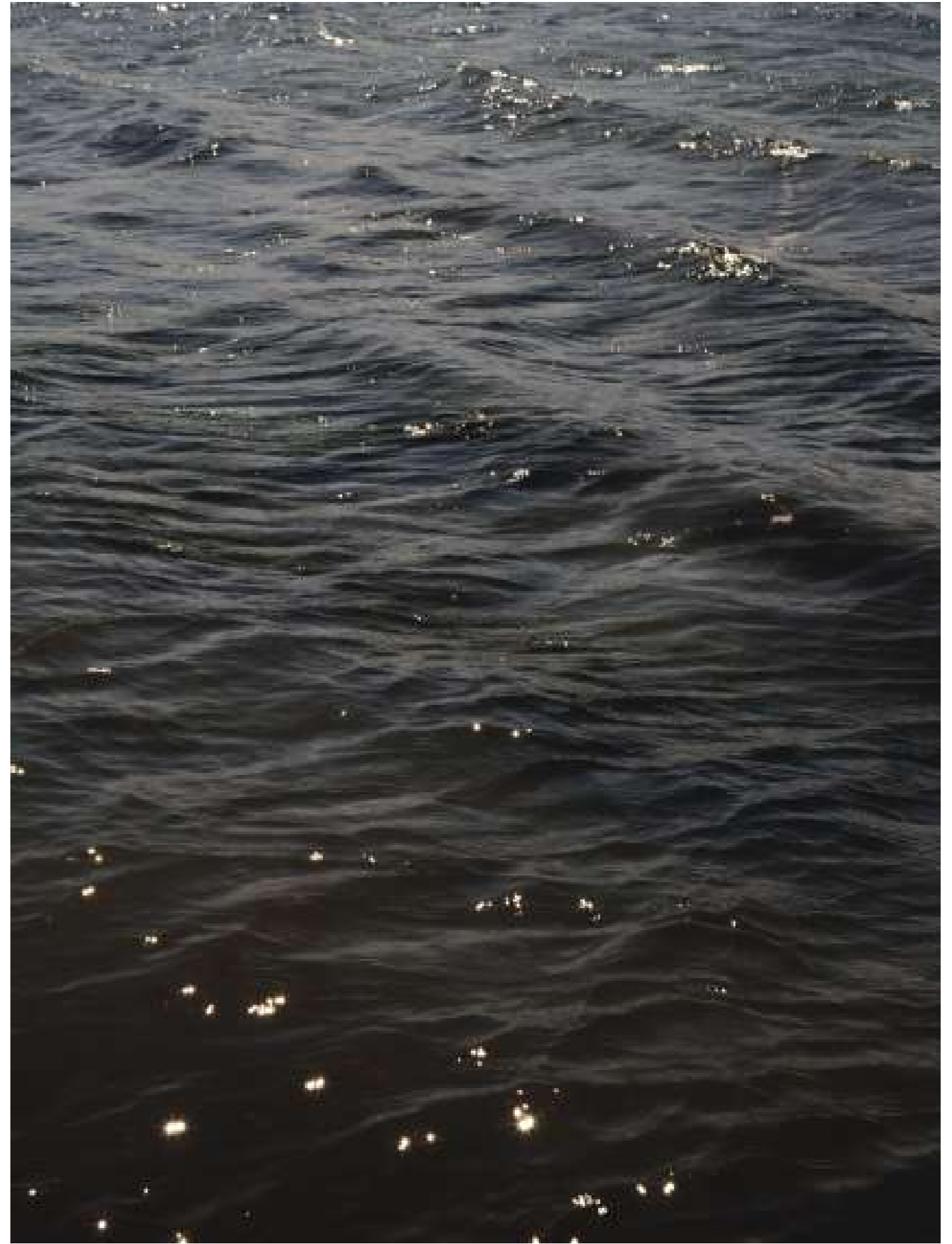
Sans titre, 2022.