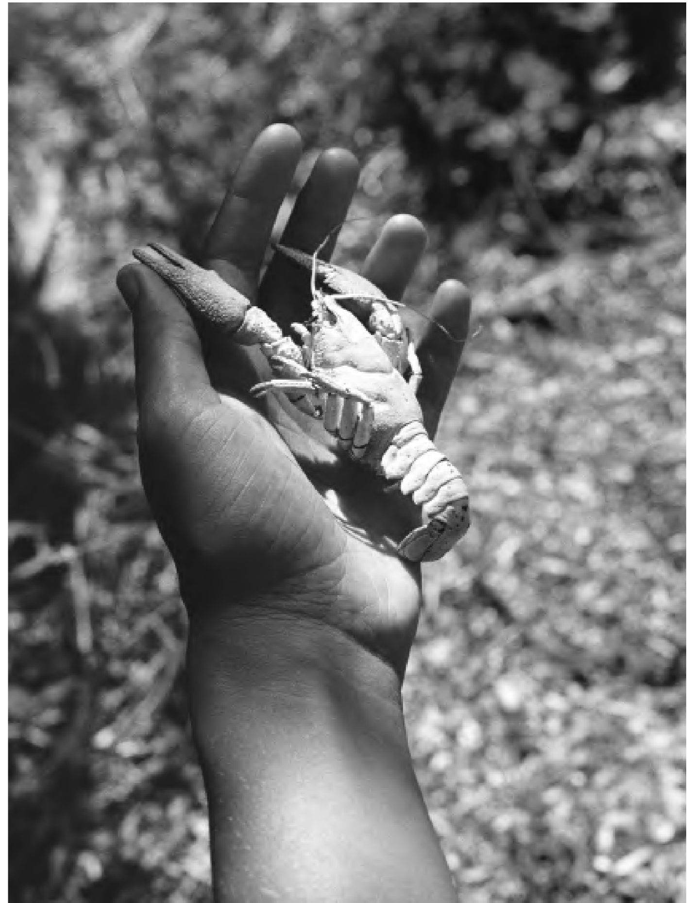
Sans titre, 2022.