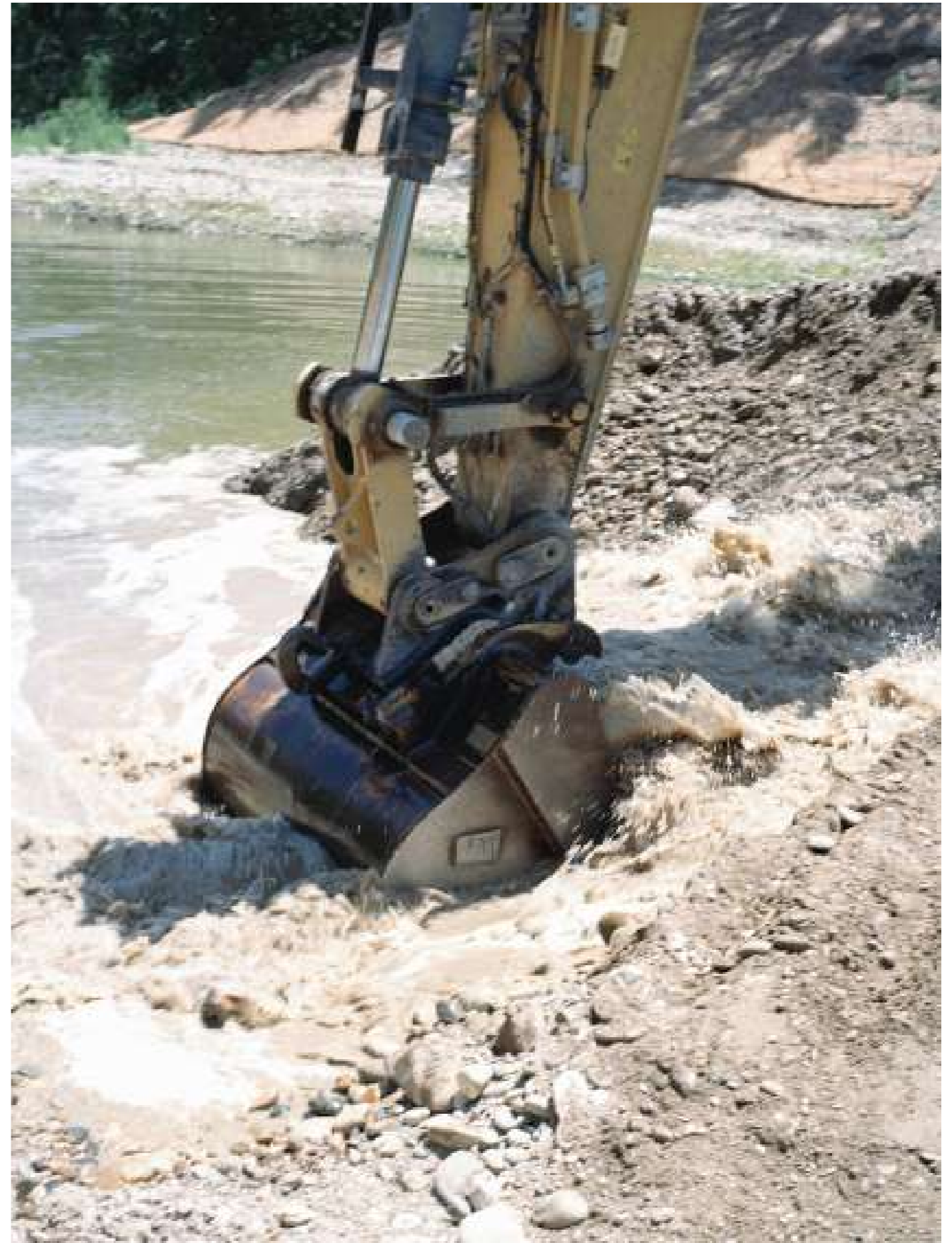
Sans titre, 2022.