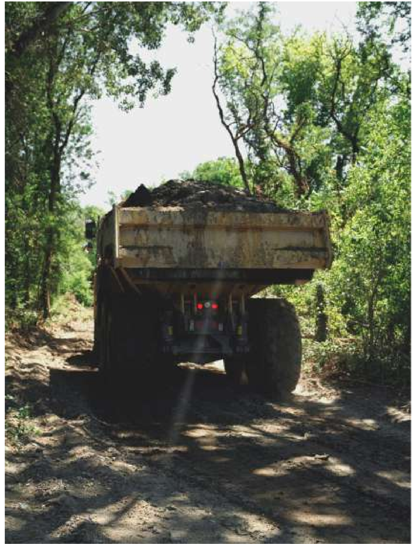
Sans titre, 2022.