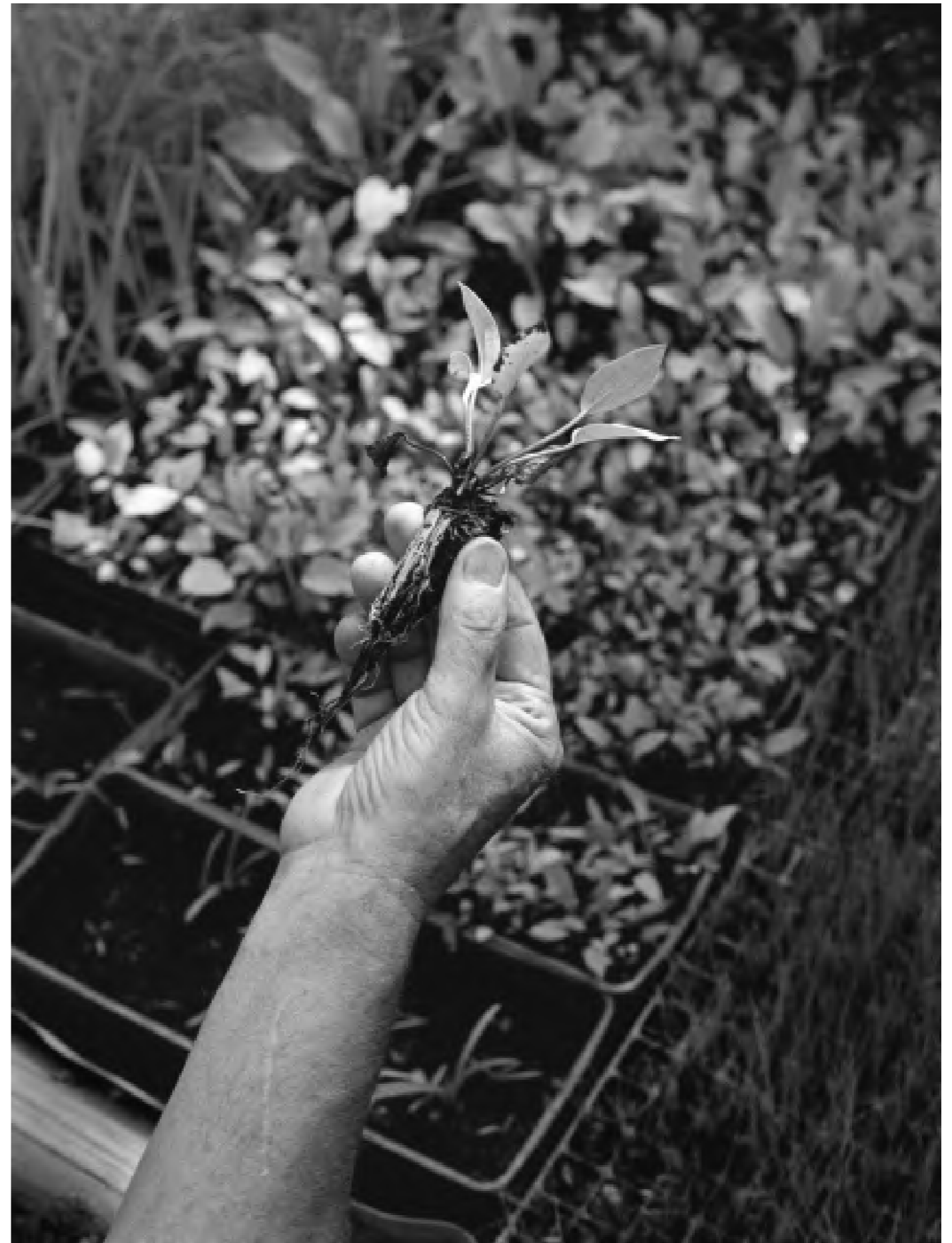
Sans titre, 2022.