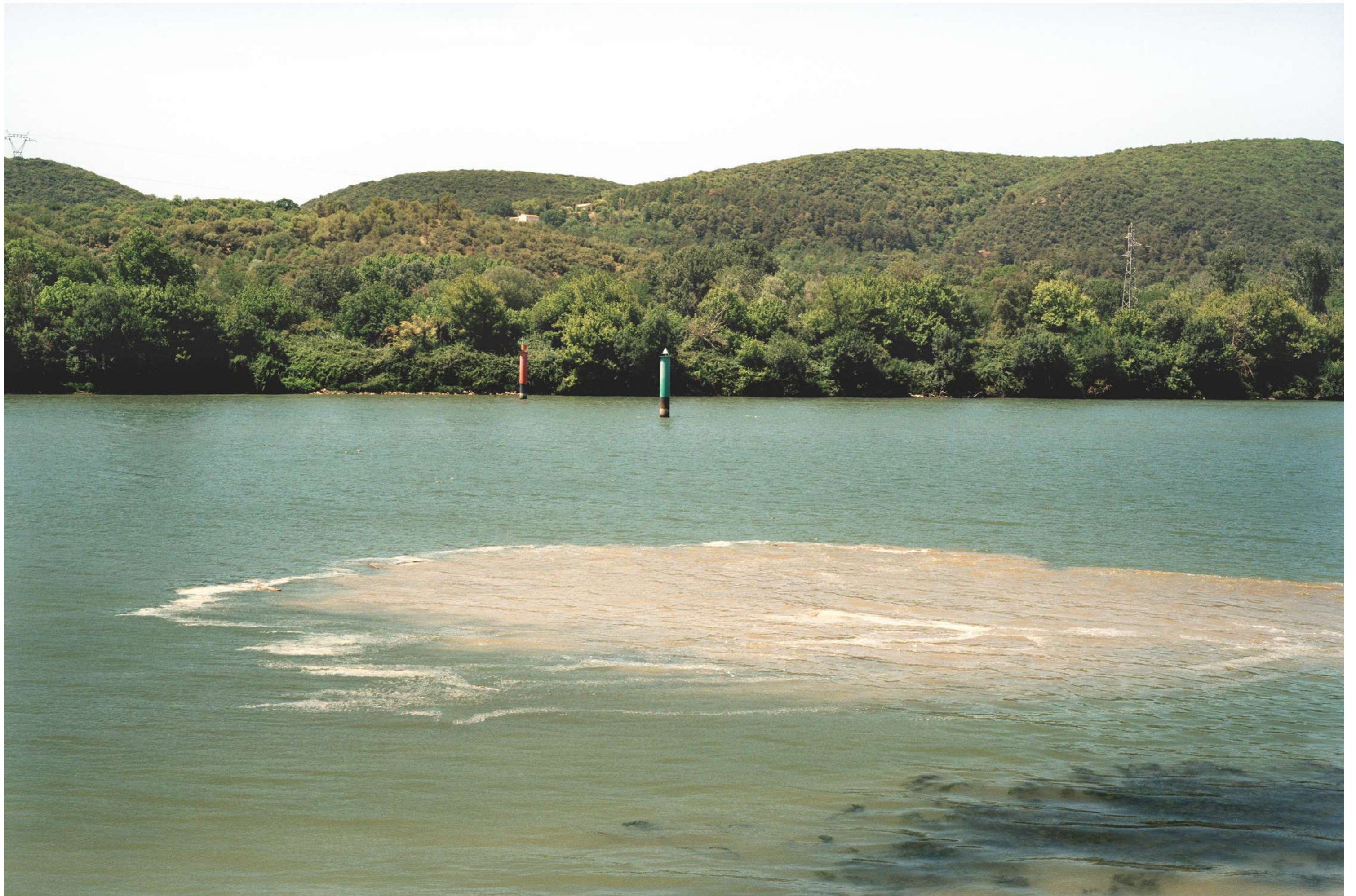
Sans titre, 2022.