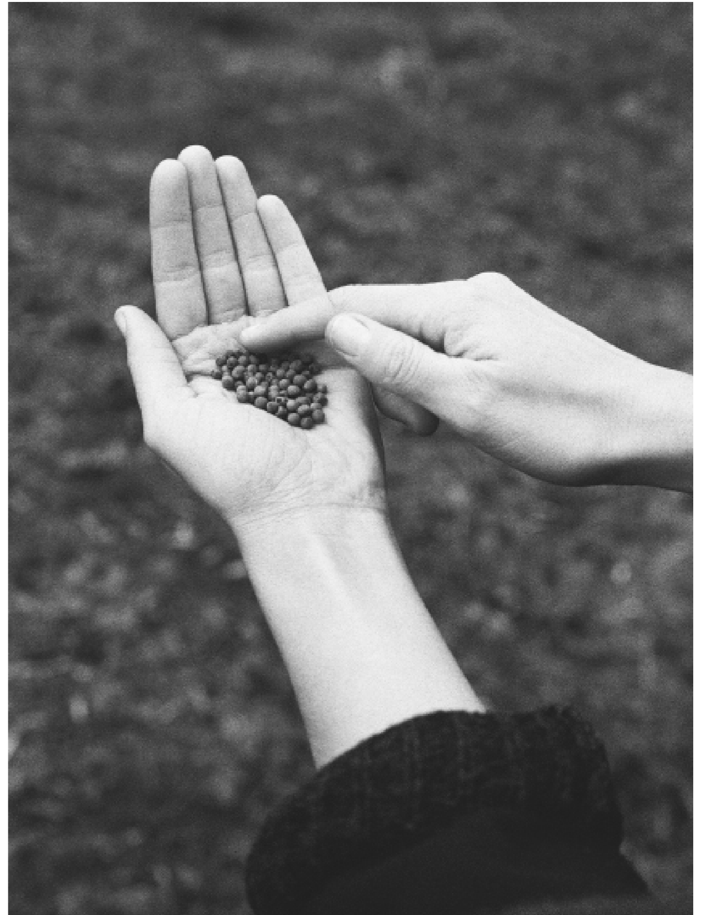
Sans titre, 2023.