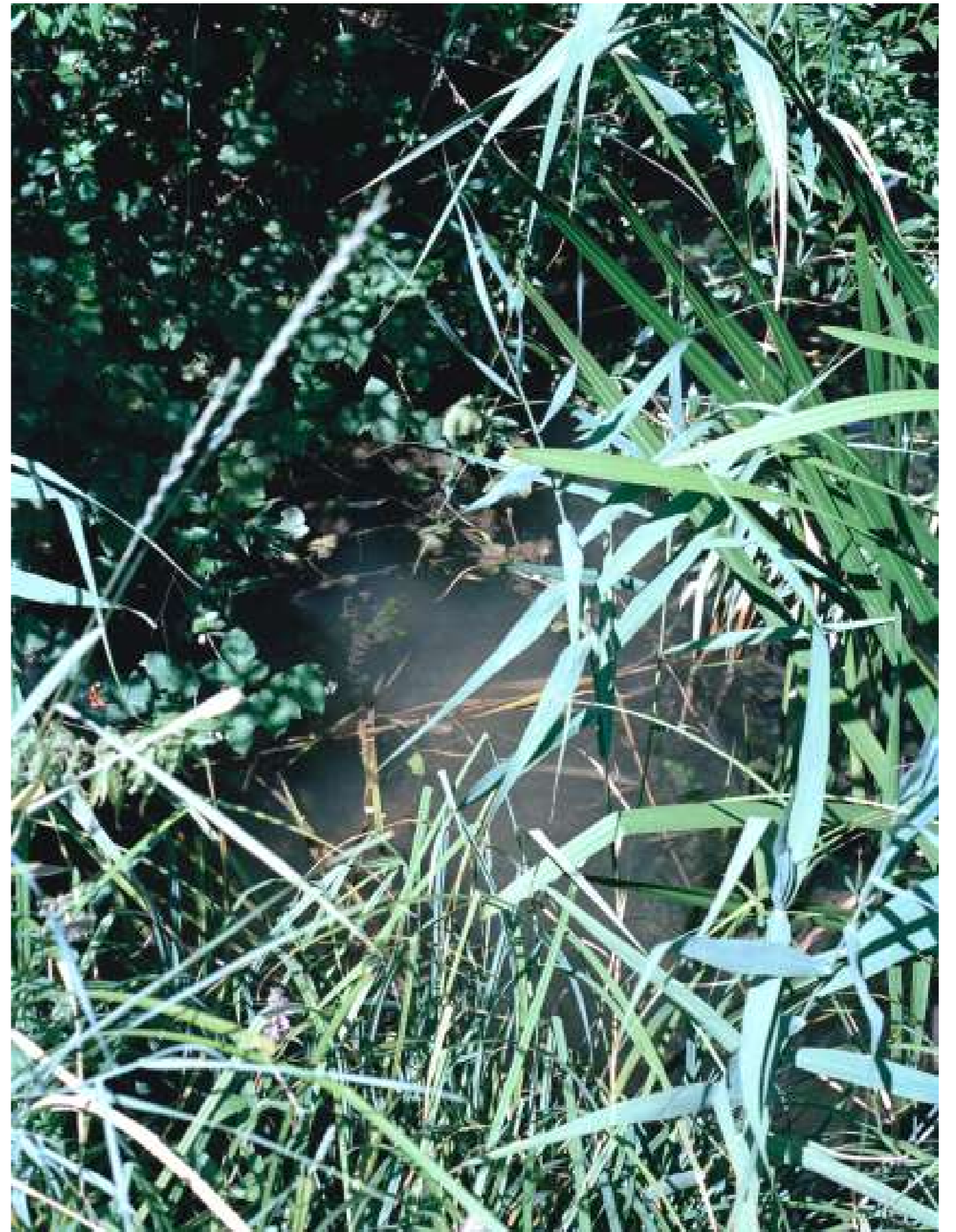
Sans titre, 2022.