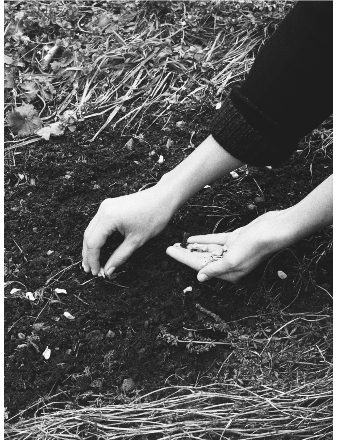
Sans titre, 2023.