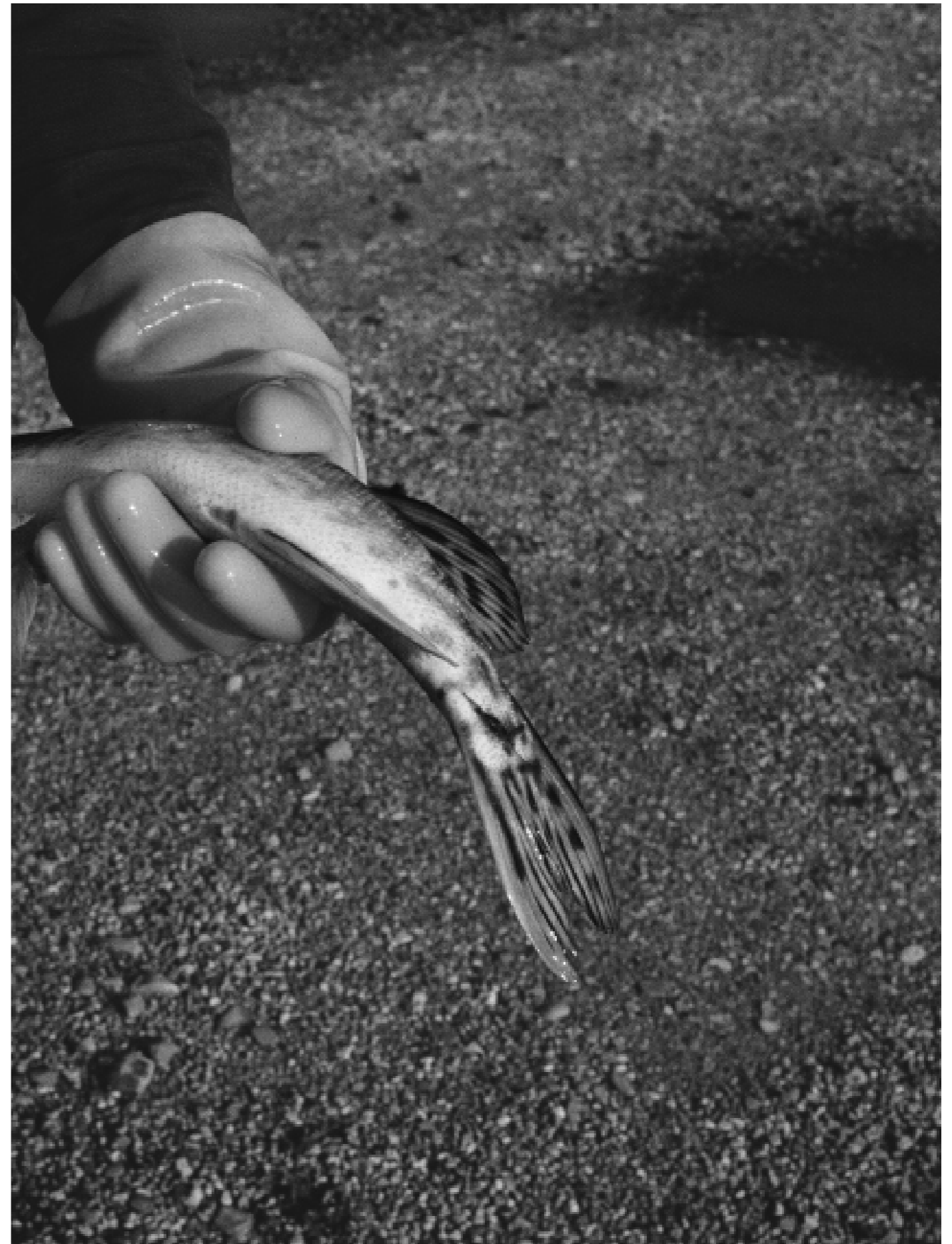
Sans titre, 2023.