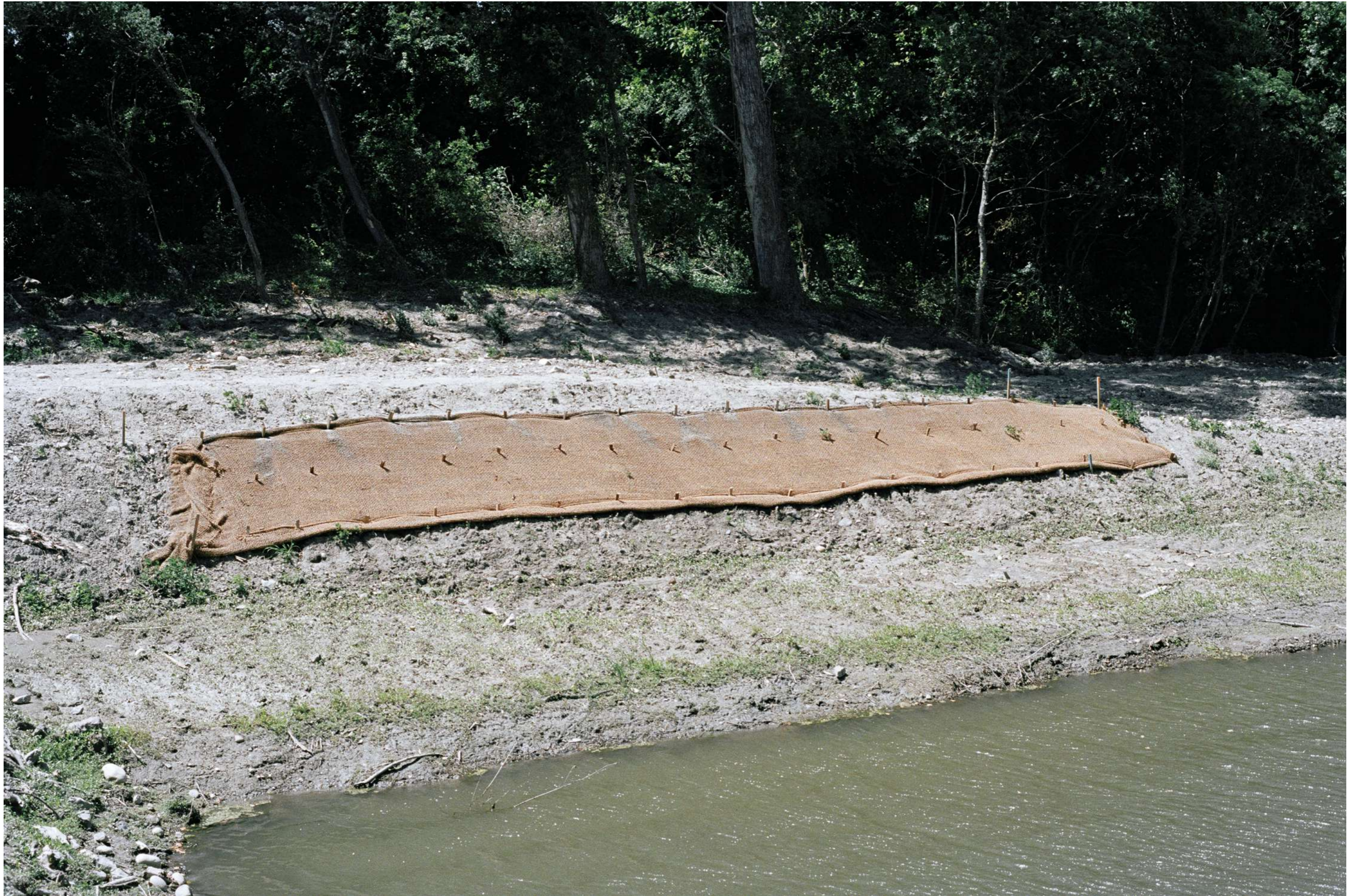
Sans titre, 2022.