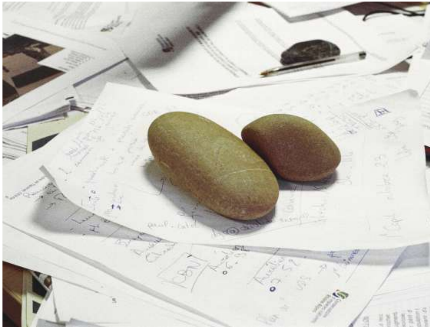
Sans titre, 2023.