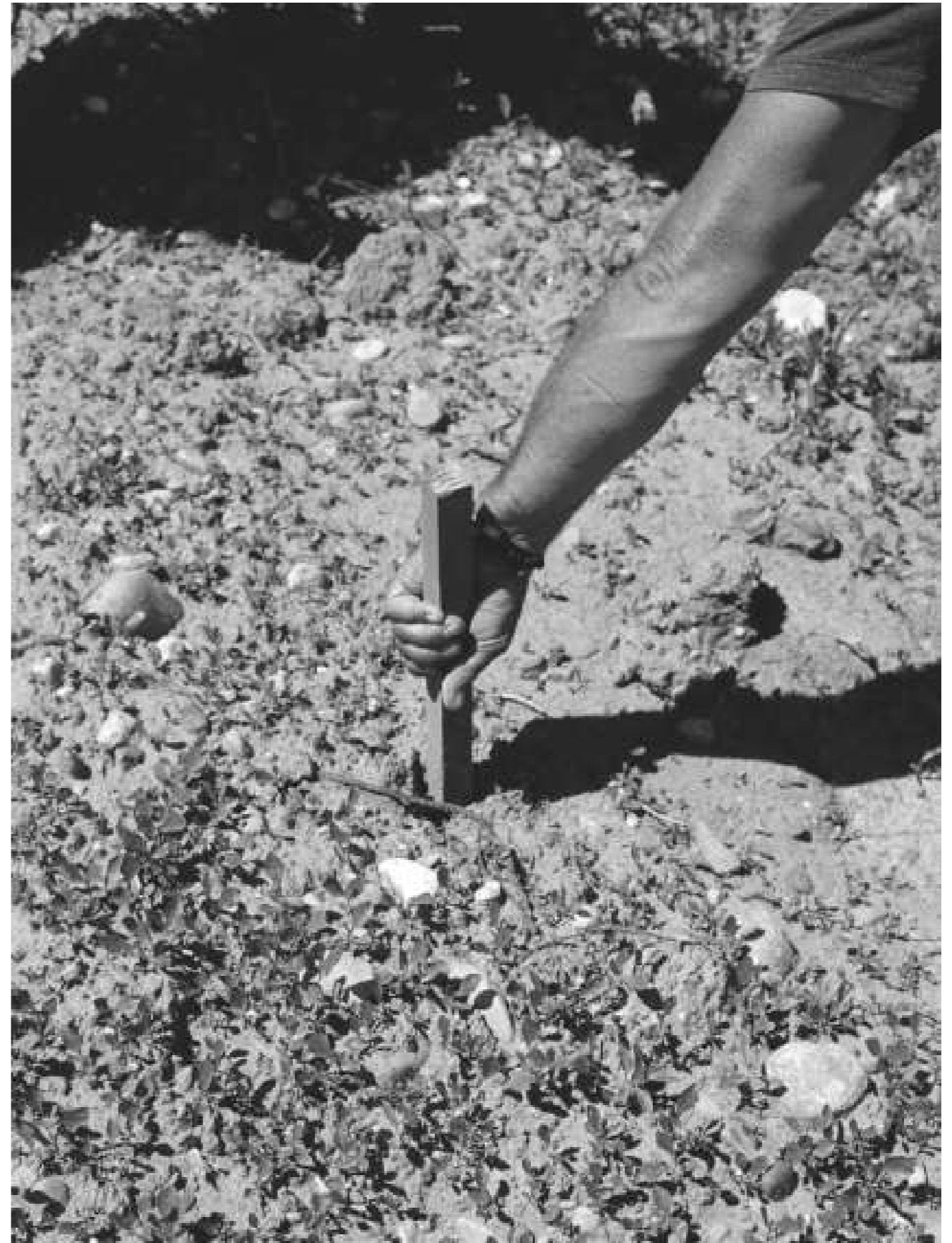
Sans titre, 2022.