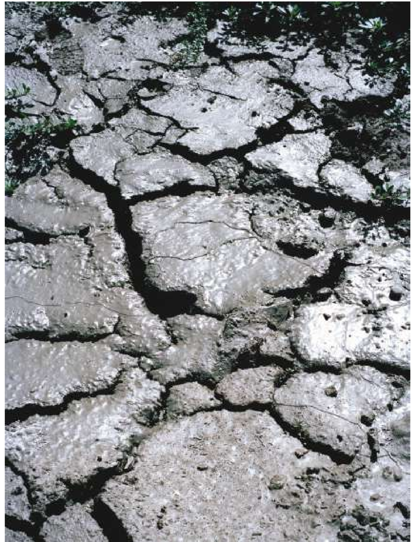
Sans titre, 2022.