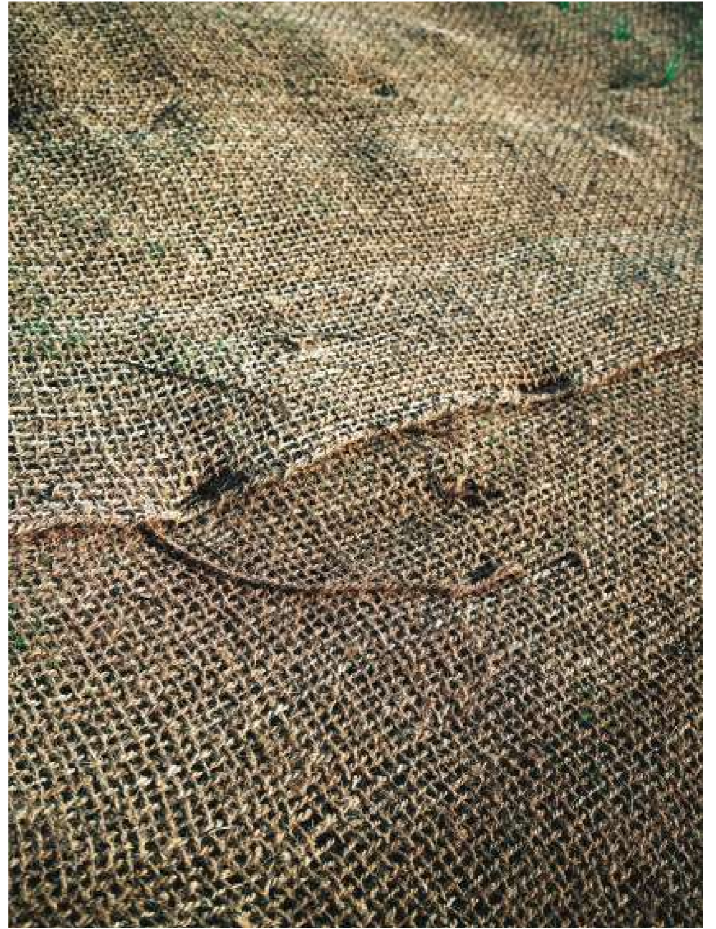
Sans titre, 2022.