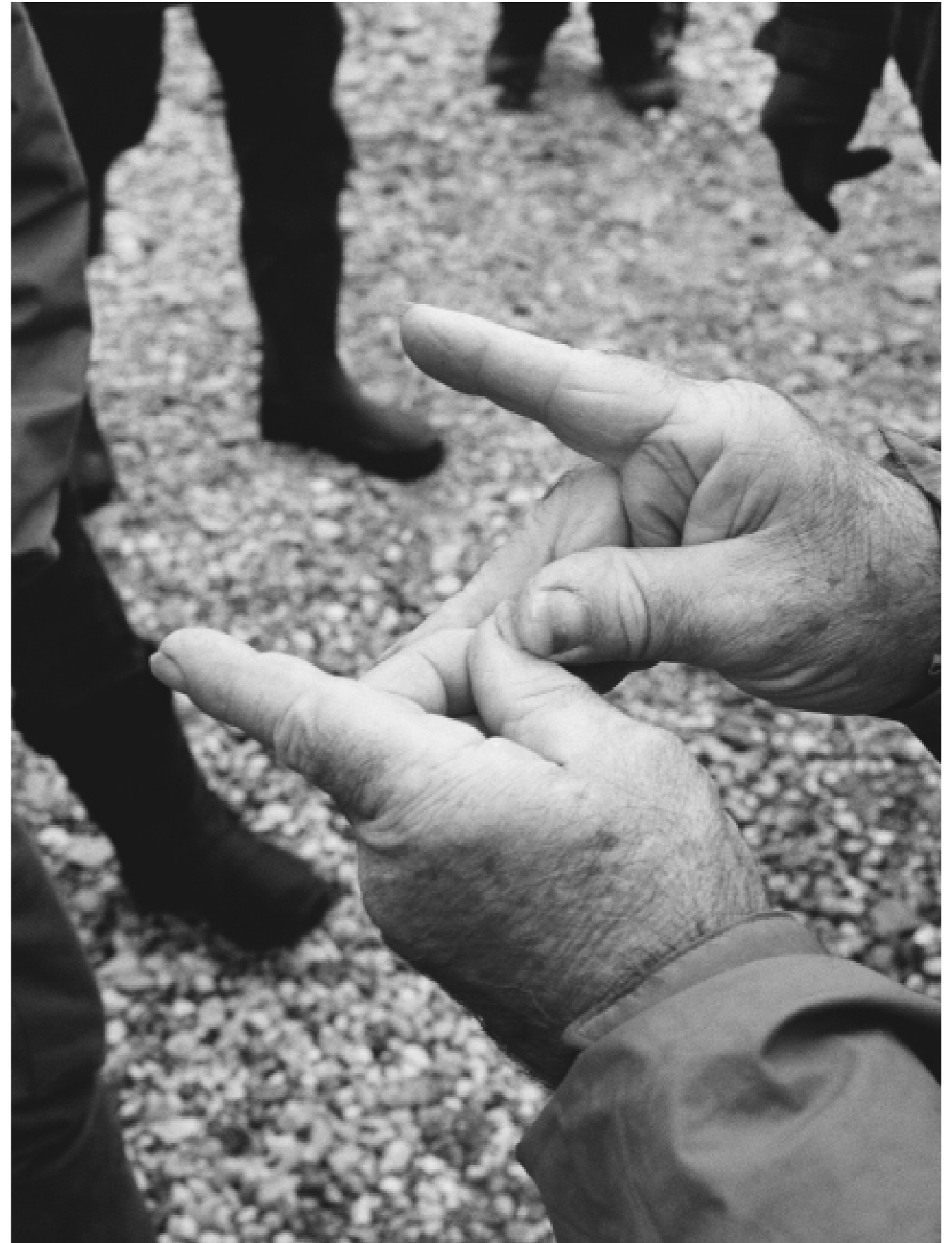
Sans titre, 2023.