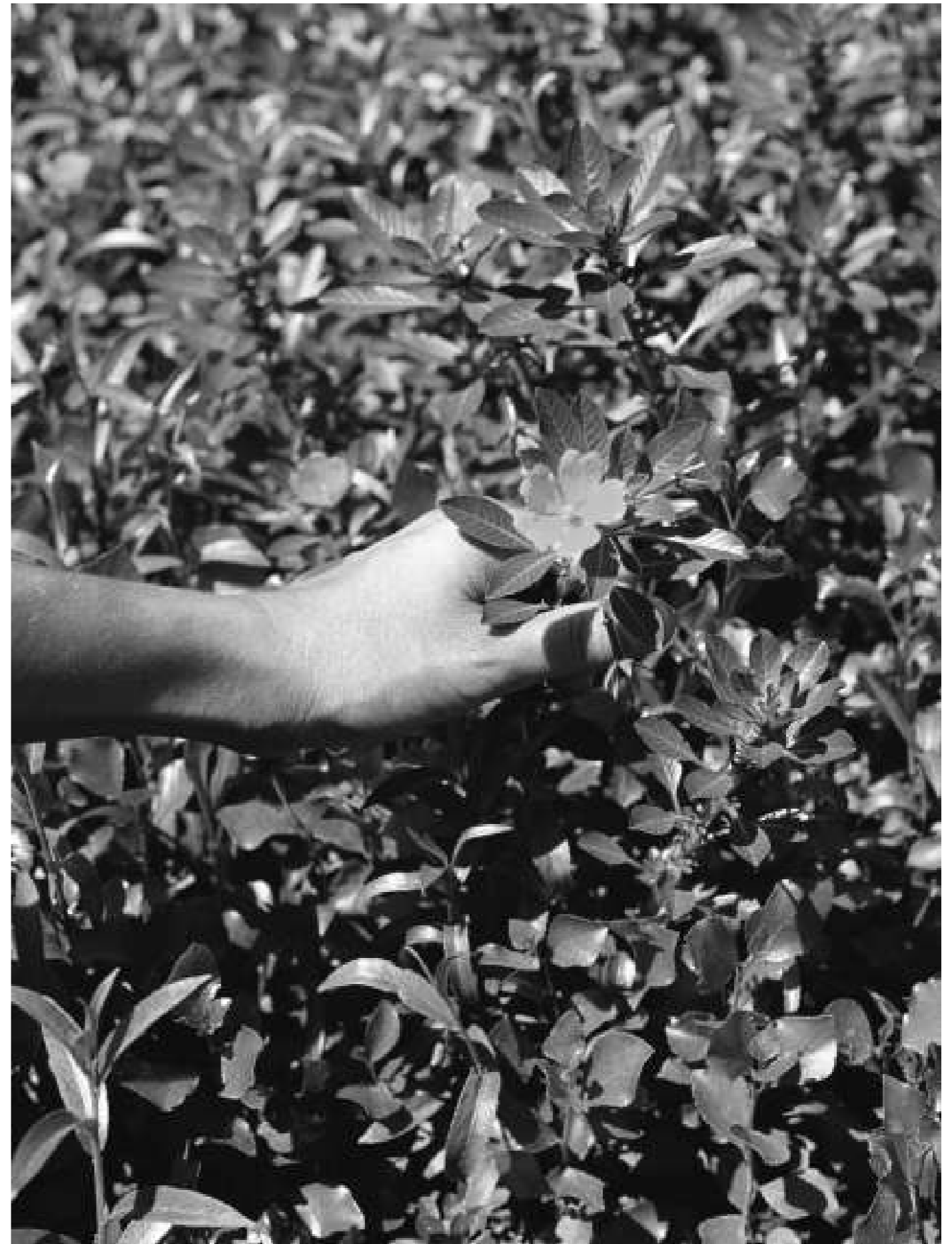
Sans titre, 2022.