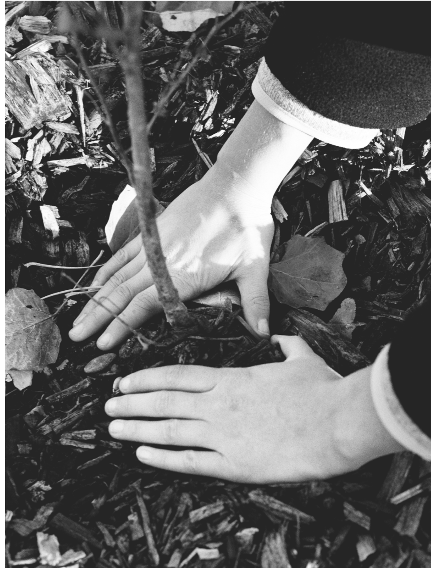
Sans titre, 2023.