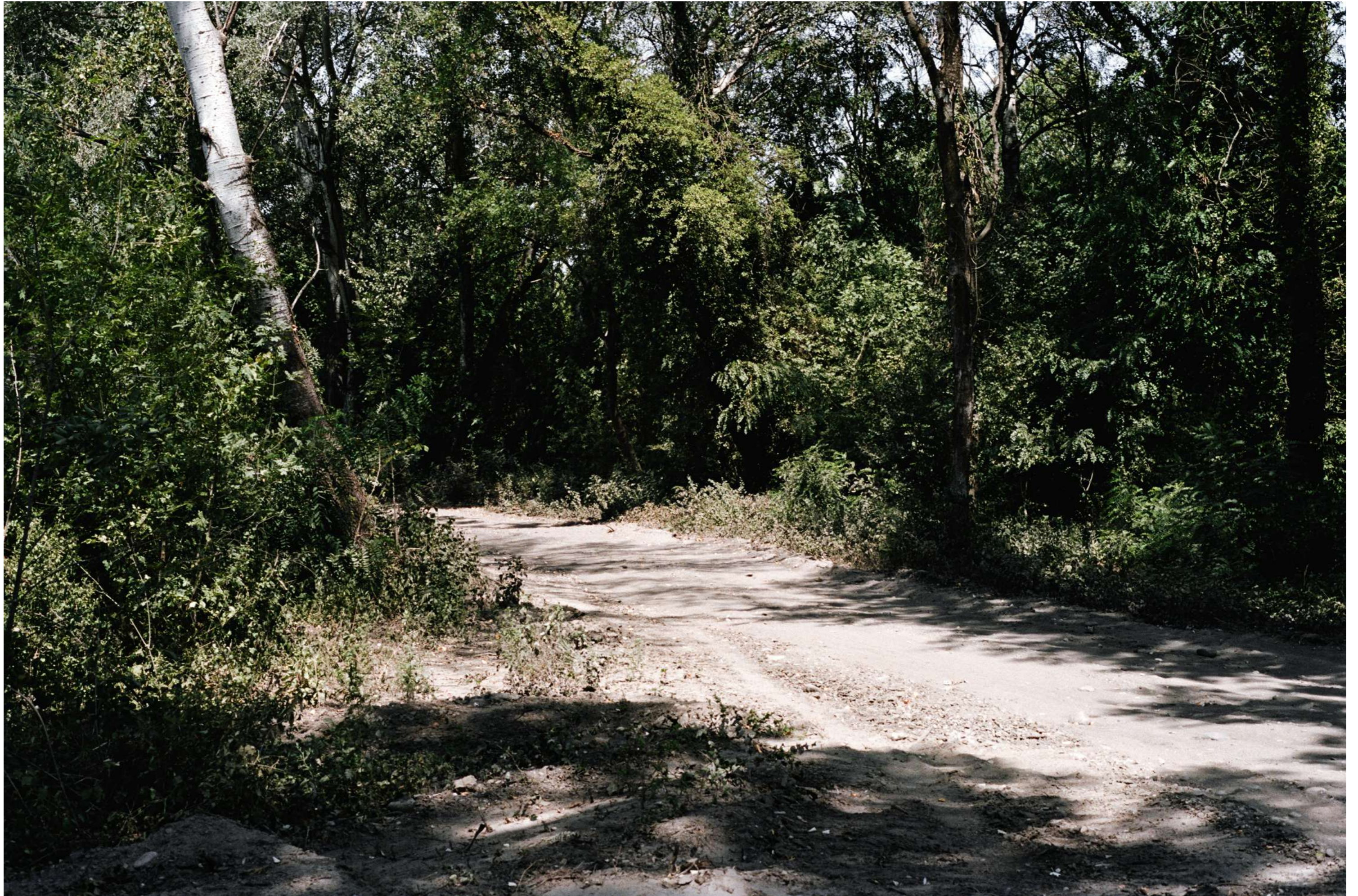
Sans titre, 2022.