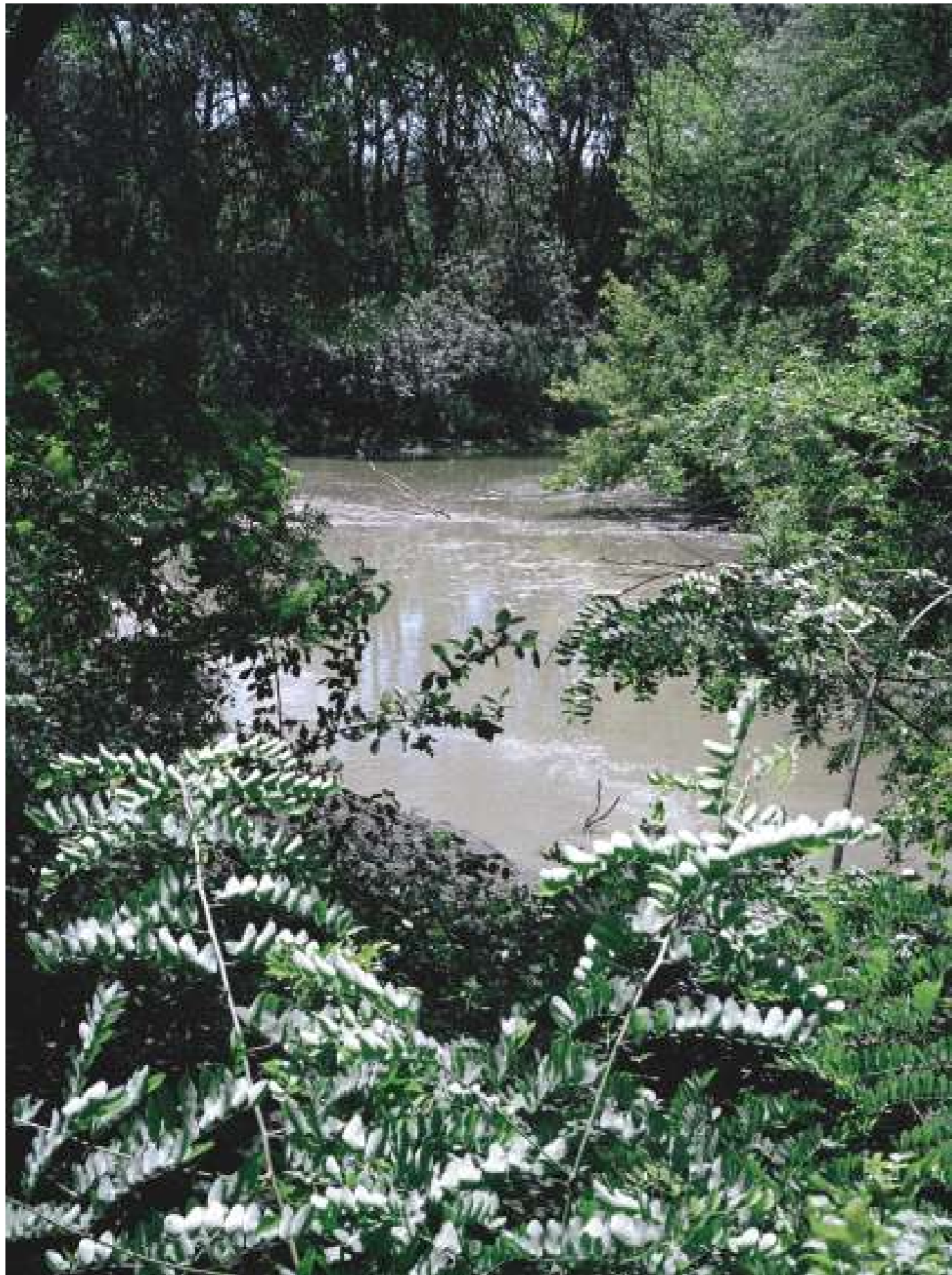
Sans titre, 2022.