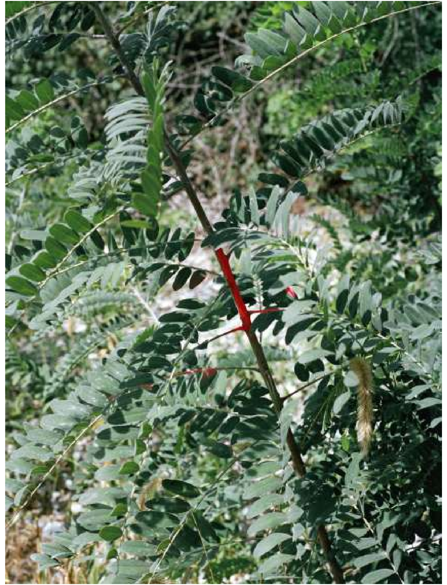
Sans titre, 2022.